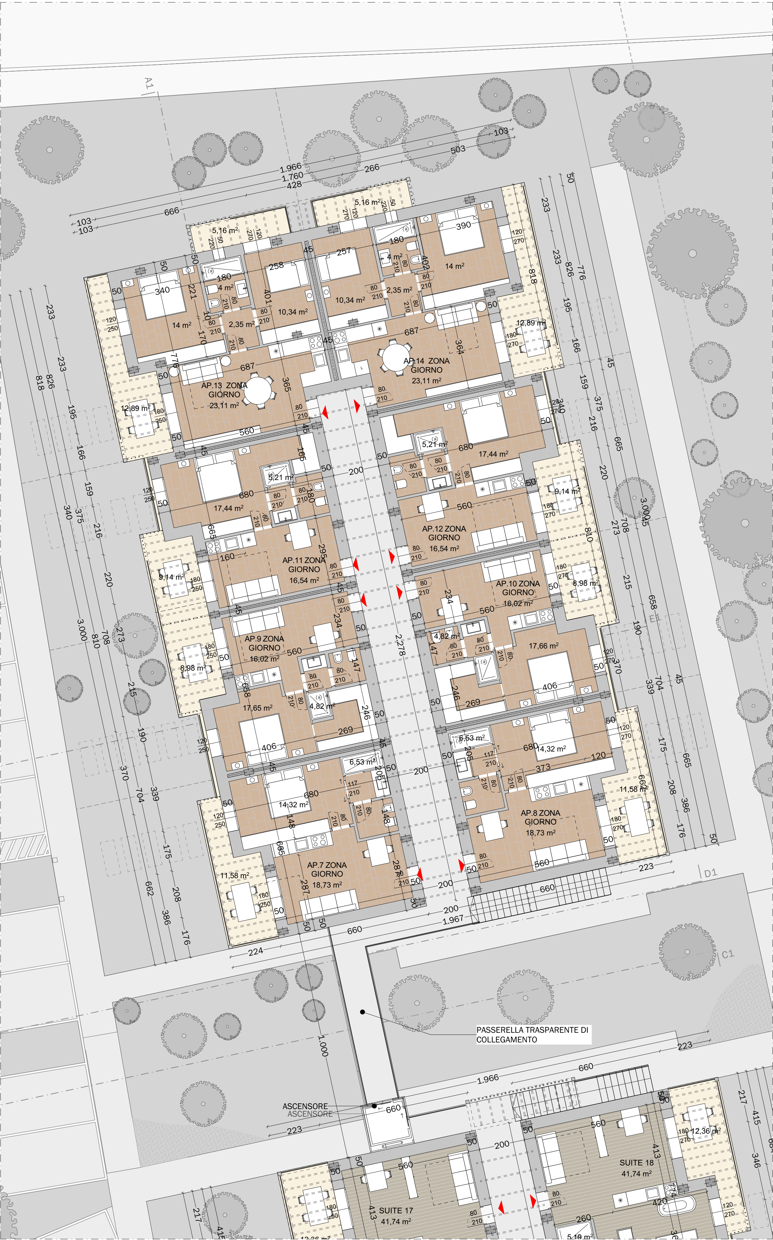
1. PIANO PRIMO - CORPO B 1:100