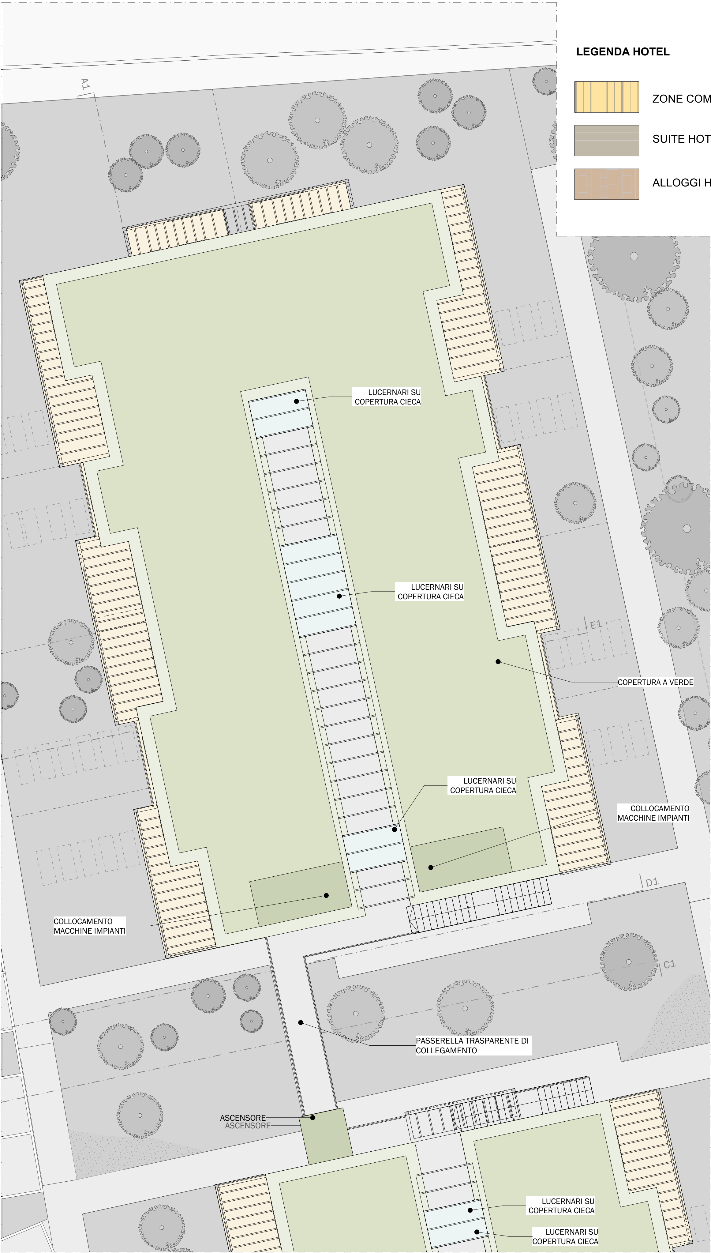
1. PIANO COPERTURE - CORPO B 1:100